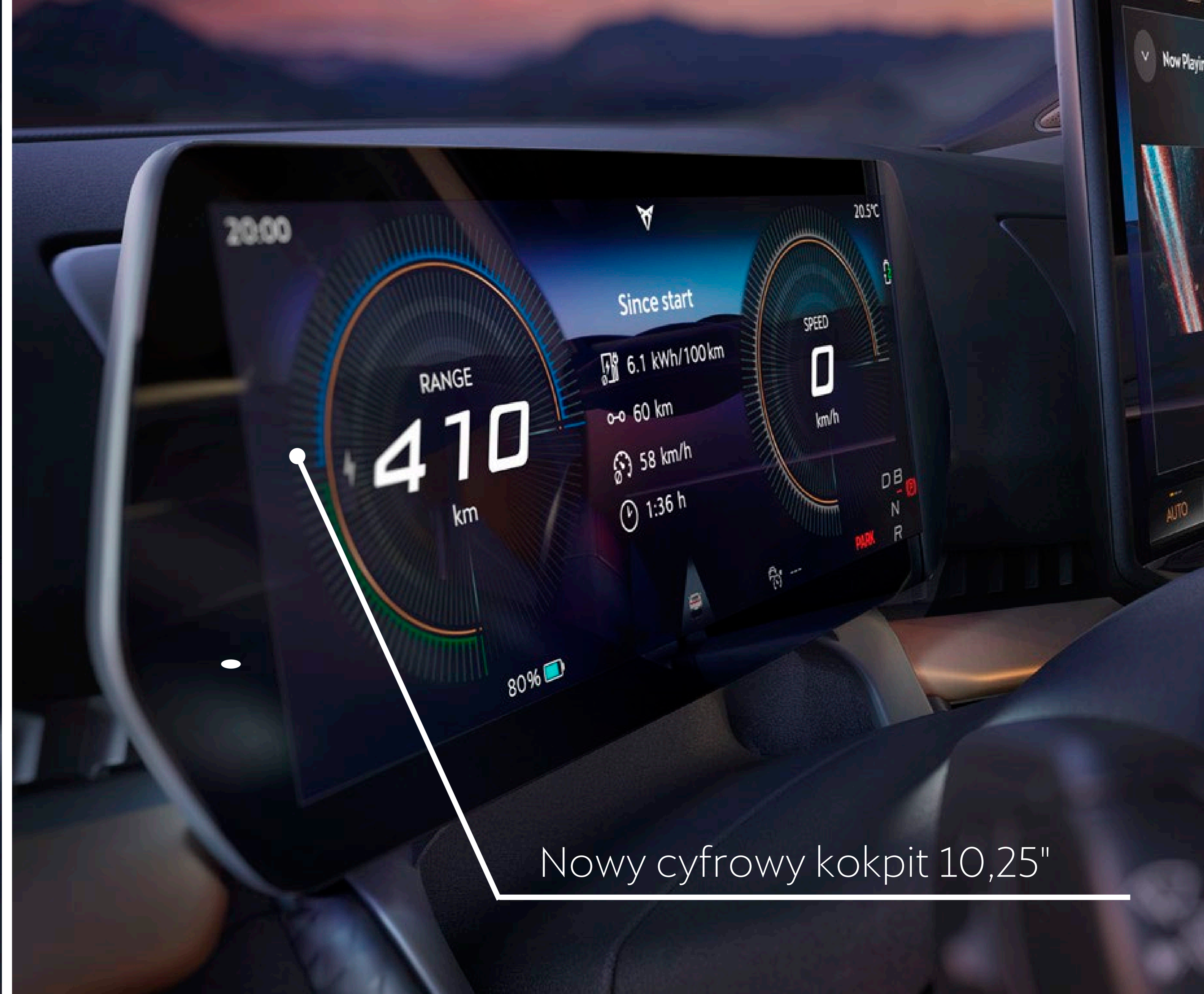
Nowy cyfrowy kokpit 10,25"