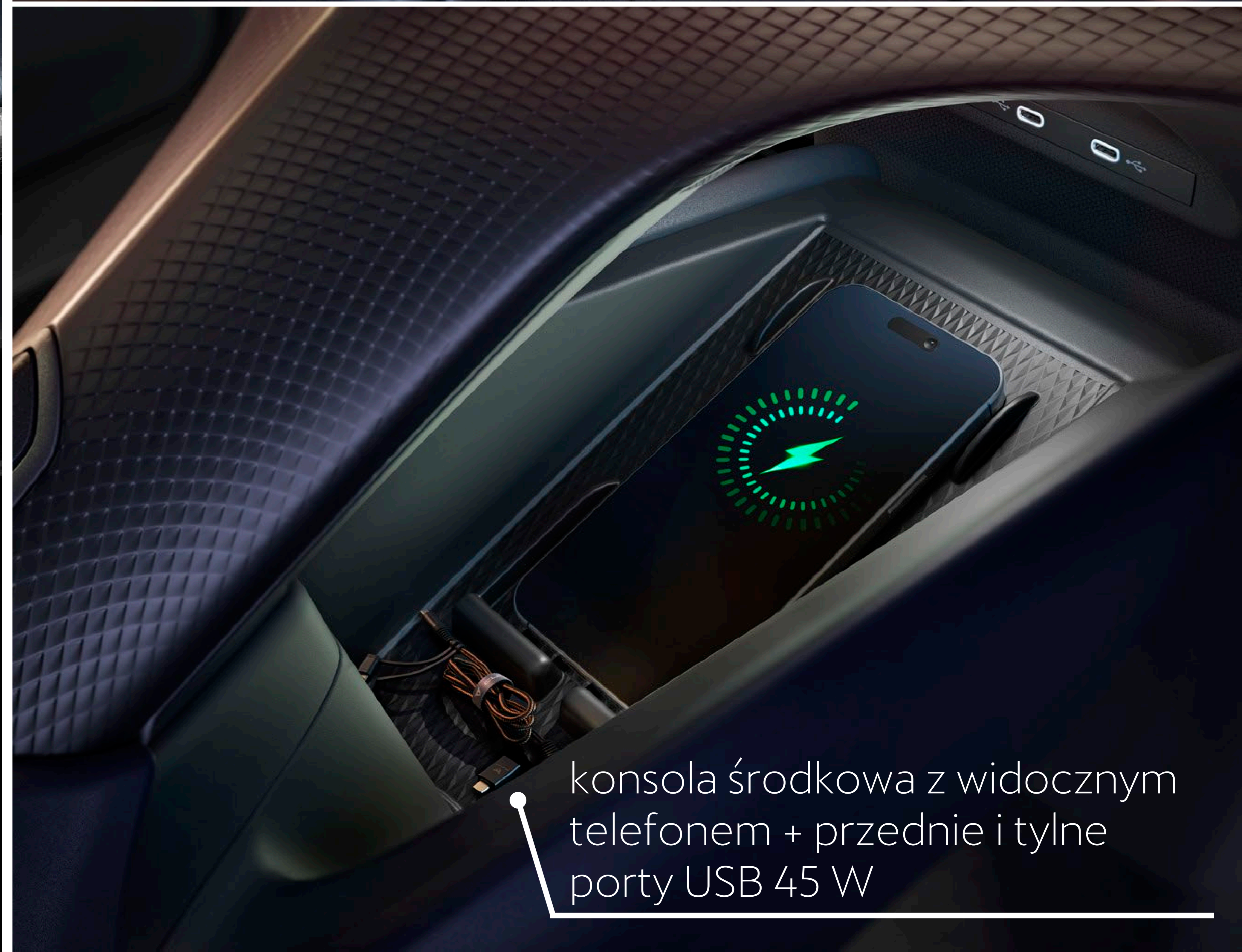
konsola środkowa z widocznym telefonem + przednie i tylne porty USB 45 W