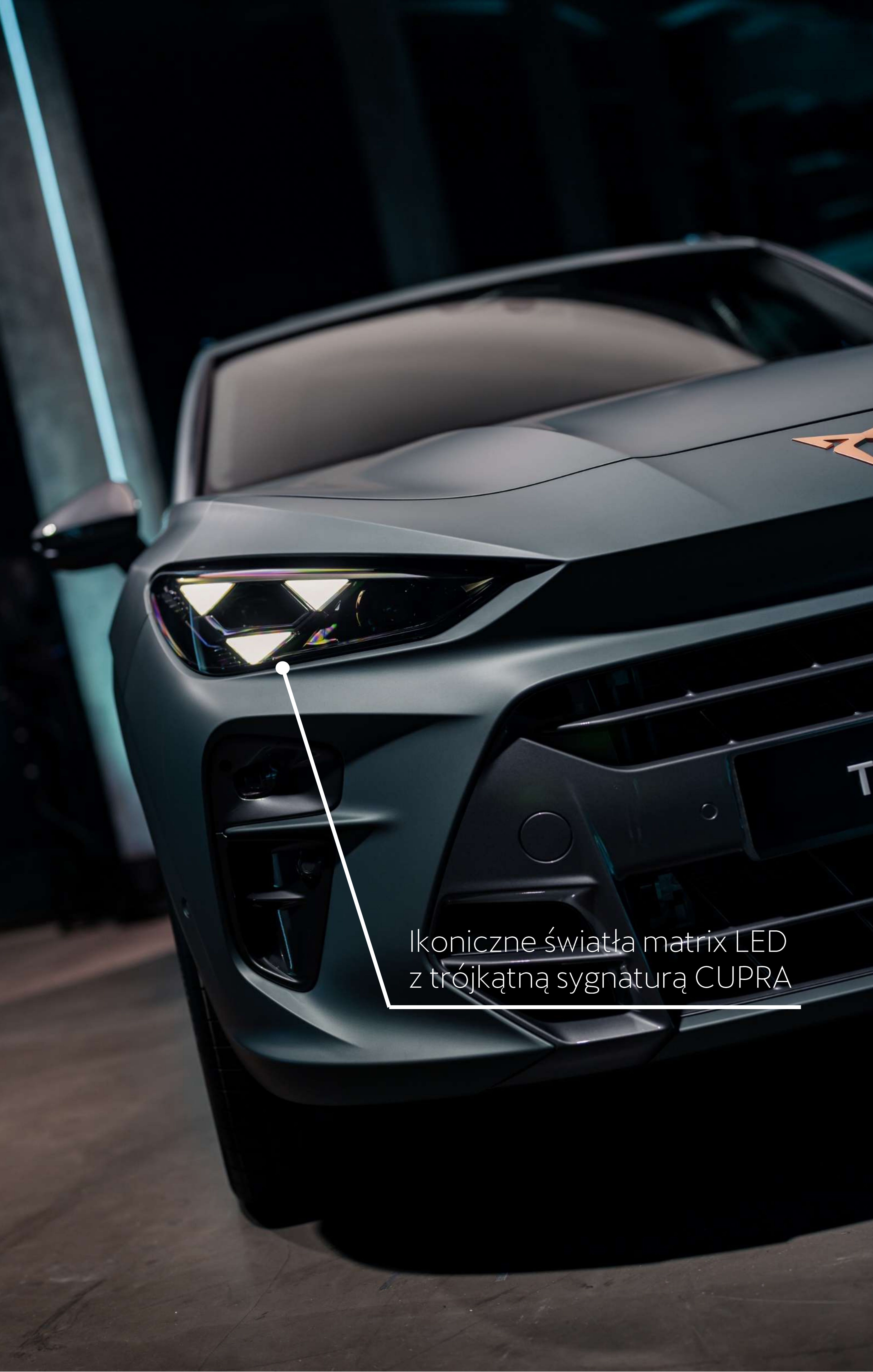
Ikoniczne światła matrix LED z trójkątną sygnaturą CUPRA