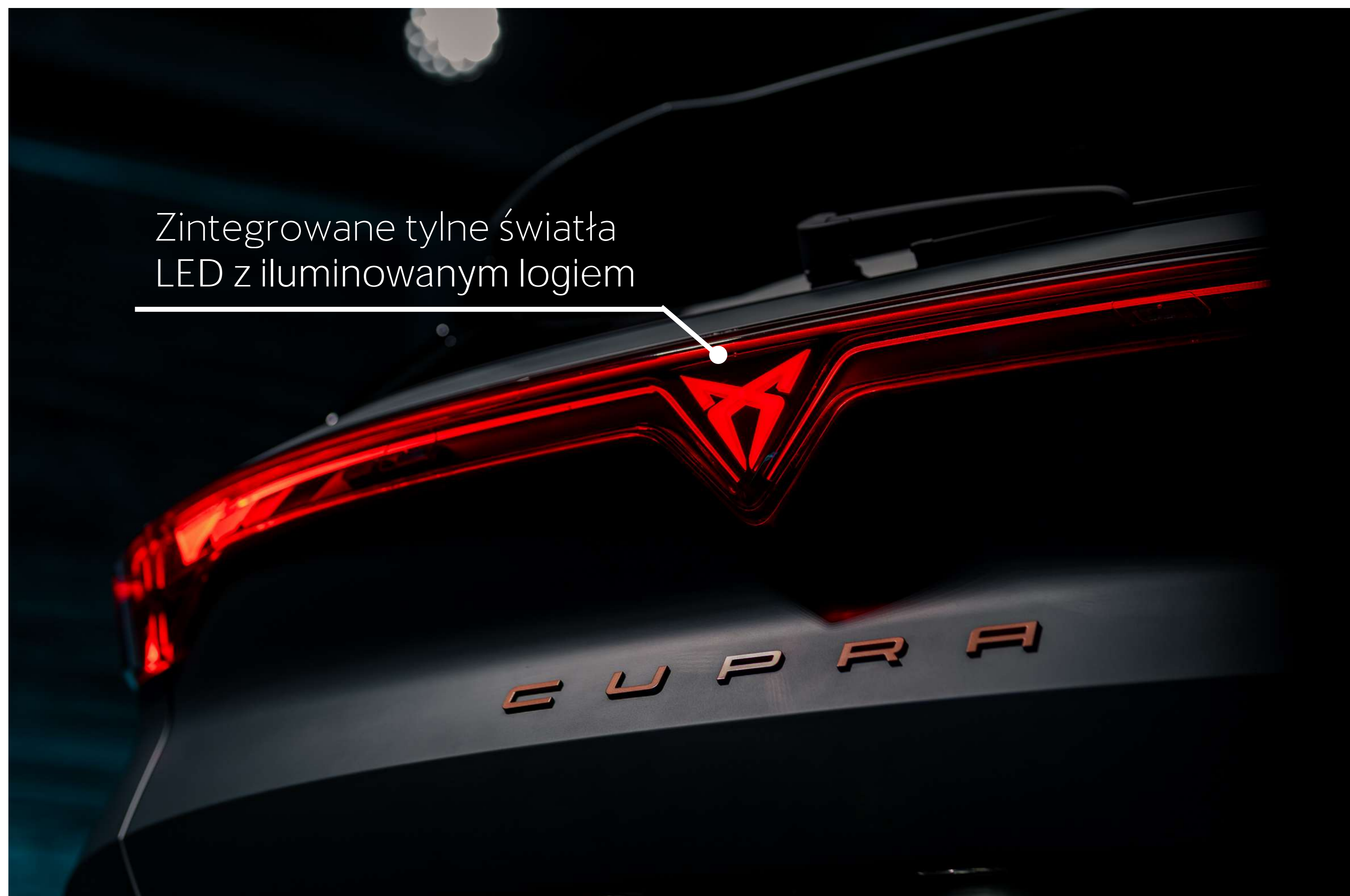
Zintegrowane tylne światła LED z iluminowanym logiem