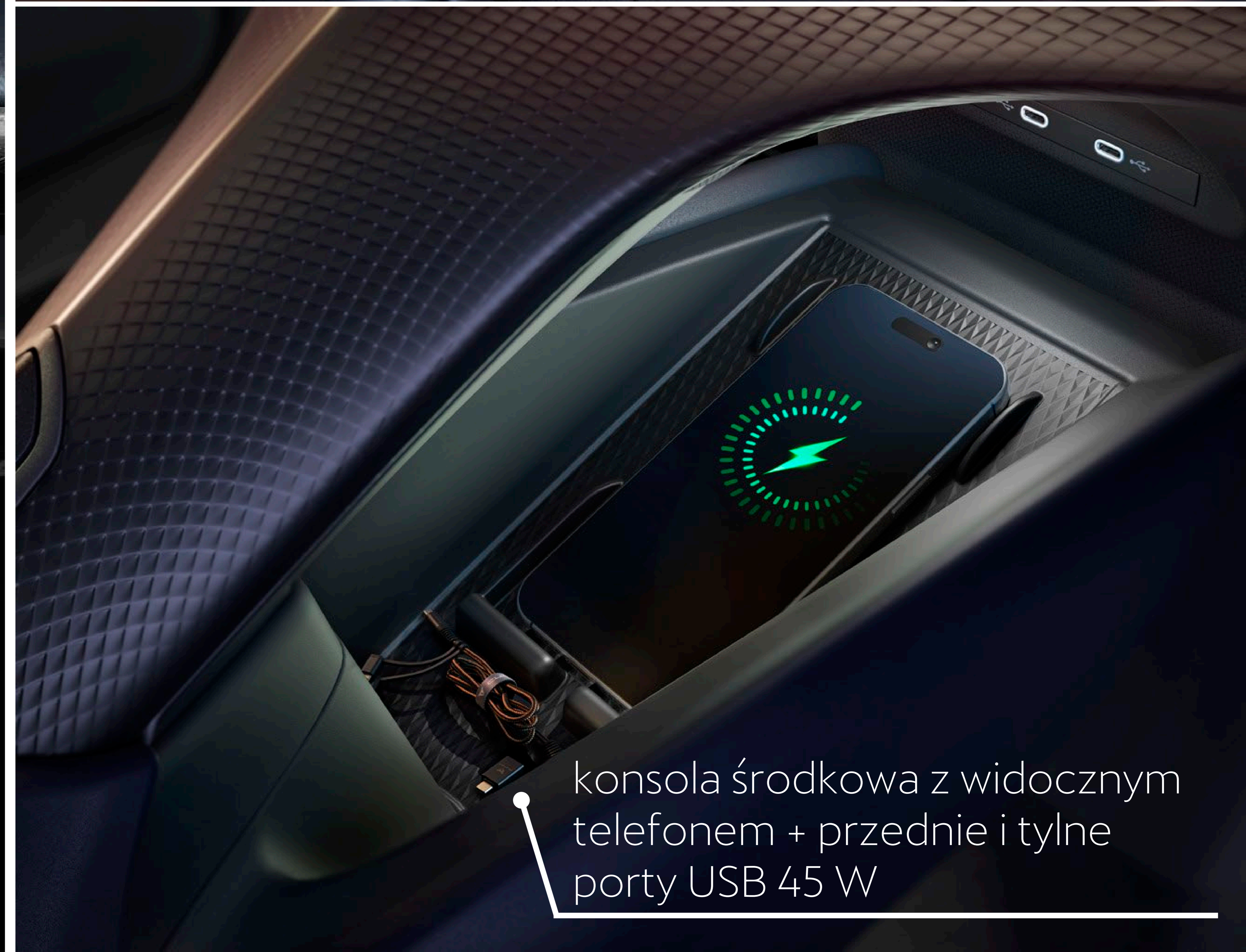
konsola środkowa z widocznym telefonem + przednie i tylne porty USB 45 W