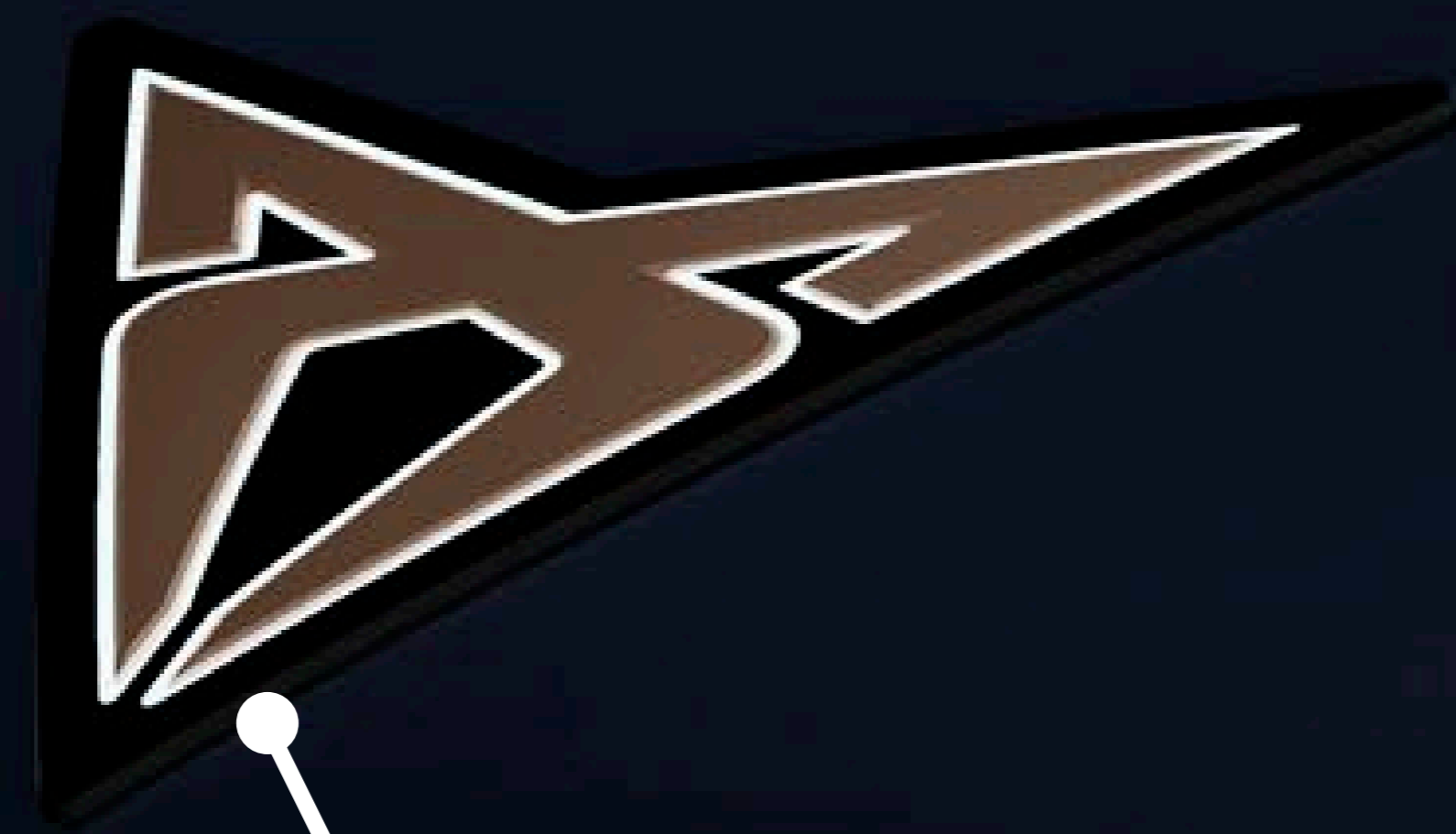
Podświetlane logo CUPRA

NOWY KIERUNEK STYLISTYCZNY I WYJĄTKOWY DESIGN MARKI CUPRA