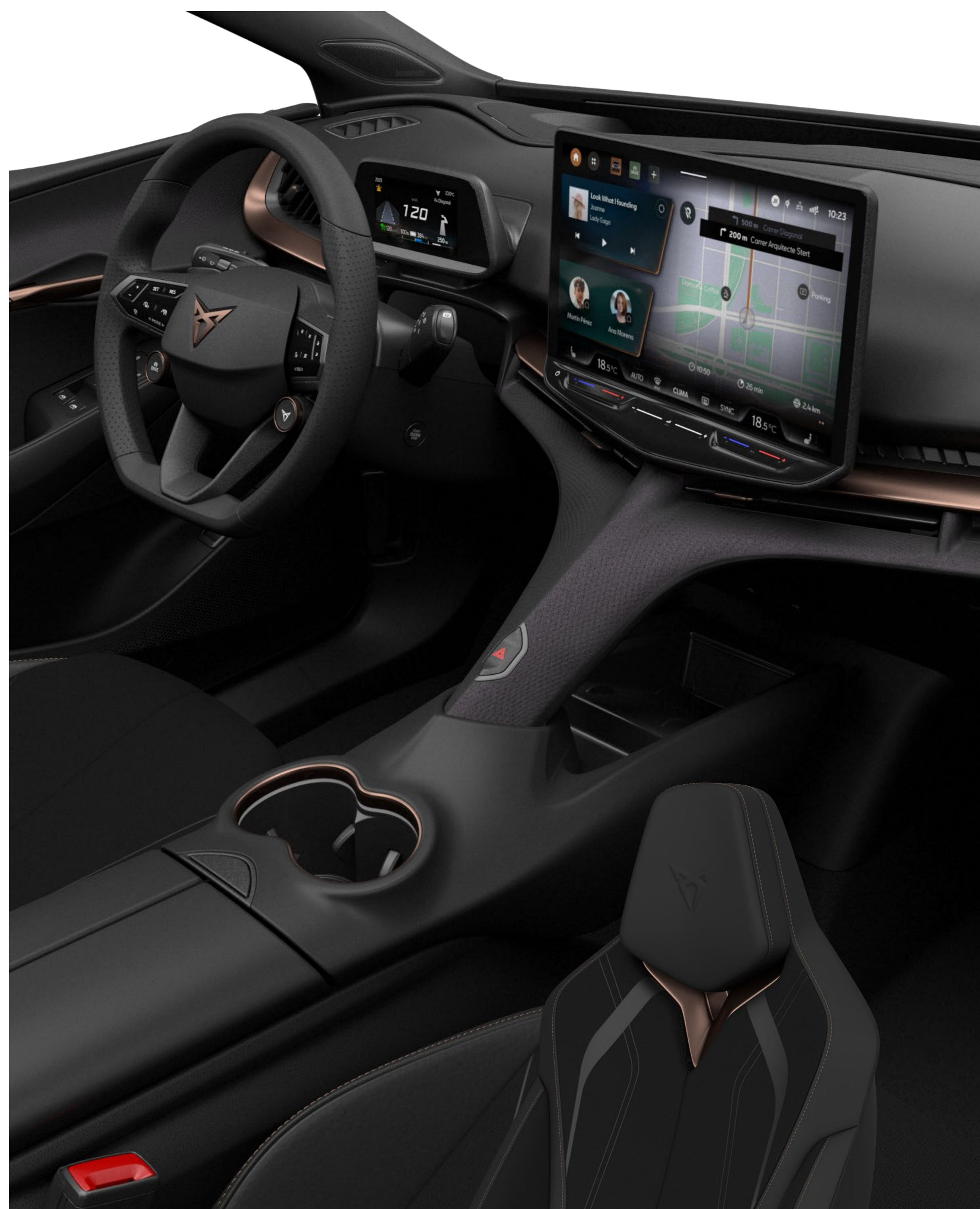
ENDURANCE / VZ

JEŚLI POTRZEBUJESZ WIĘCEJ – DOBIERZ WYPOSAŻENIE OPCJONALNE WNĘTRZA