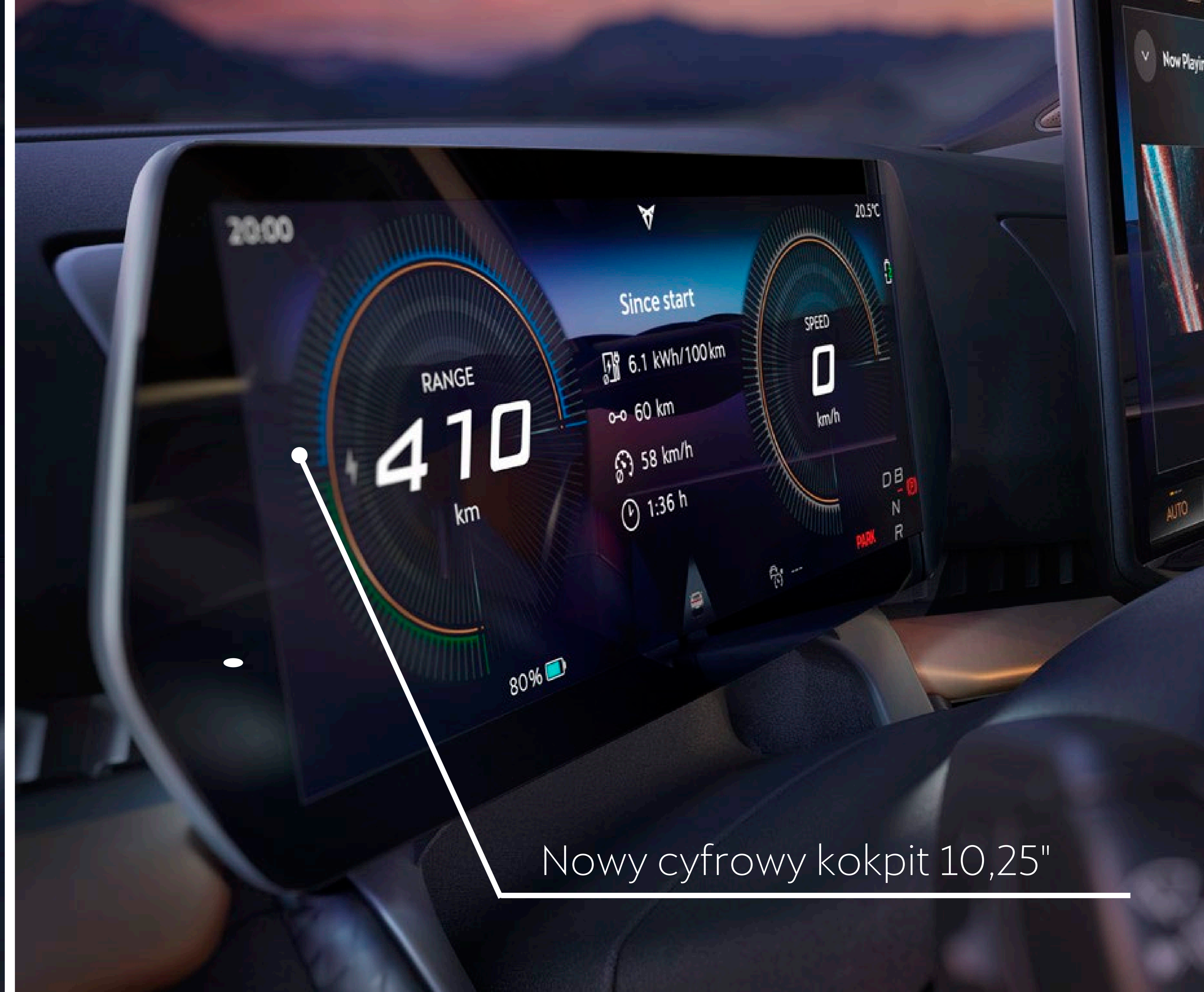
Nowy cyfrowy kokpit 10,25"